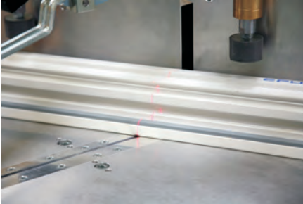
Abb./fig. 2: Laser-Schnittspaltanzeige Laser cutting gap display